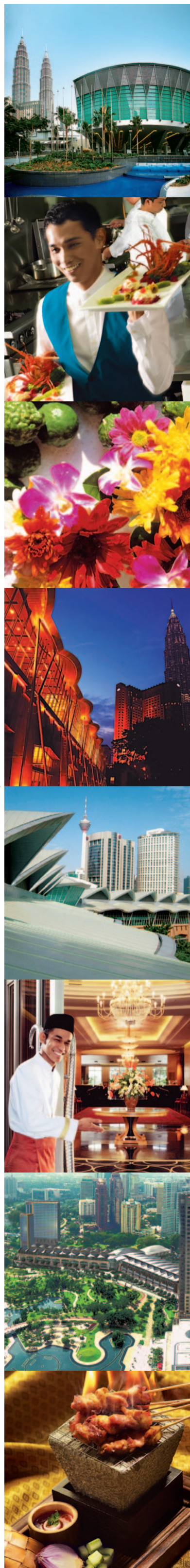
KUALA LUMPUR CONVENTION CENTRE - SPANISH - ESPAÑOL