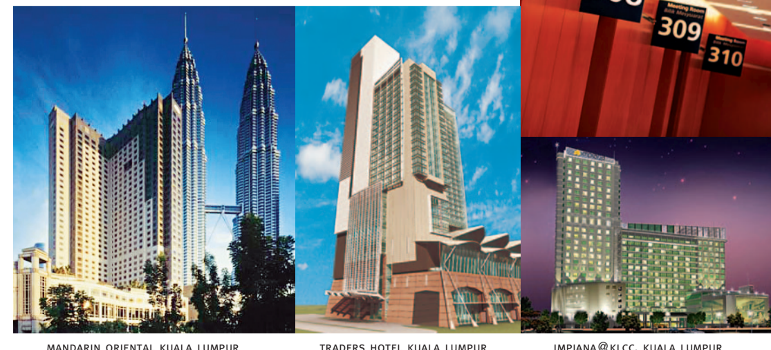
MANDARIN ORIENTAL KUALA LUMPUR TRADERS HOTEL KUALA LUMPUR IMPIANA@KLCC, KUALA LUMPUR

IMPIANA@KLCC, KUALA LUMPUR El Impiana Hotel, cuya inauguración está prevista para mediados de 2005, está situado frente al Centro de Congresos de Kuala Lumpur. Cuenta con 348 espaciosas habitaciones y suites, con superficies de entre 30 y 36 metros cuadrados. El Centro de Congresos del hotel ofrece una abundancia de instalaciones y personal cualificado para responder a las peticiones de servicios de secretaría y apoyo empresarial.